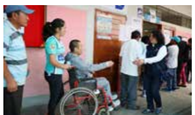
Electora con discapacidad cumpliendo con su deber cívico en Guadalupe (La Libertad).