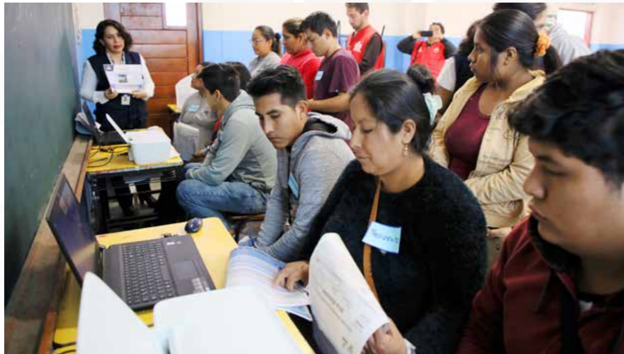
Capacitación a miembros de mesa en el Sistema de Escrutinio Automatizado