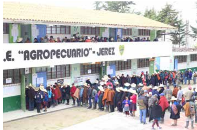
Día de elecciones en el centro poblado de Jerez (Cajamarca).

La convocatoria obedeció a que en las Elecciones Regionales y Municipales del 2018, el Jurado Nacional de Elecciones declaró la nulidad de los comicios en doce distritos en nueve regiones del País. Decreto Supremo N° 001-2019-PCM.