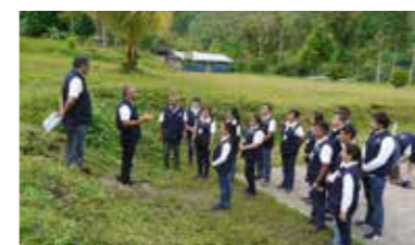
Personal de la ONPE en Aramango coordinan acciones previas al proceso electoral.