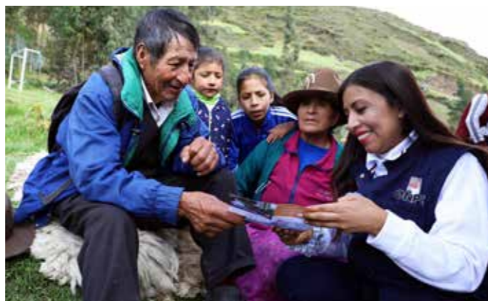
Capacitación a electores del distrito de Mirgas (Huaraz)

La totalidad de mesas de sufragio instaladas, el procesamiento veloz de actas para su escrutinio, la publicación rápida de los resultados y el desarrollo de la jornada en un clima de paz y tranquilidad, fueron algunas características positivas de las elecciones municipales complementarias del pasado 7 de julio y organizadas por la Oficina Nacional de Procesos Electorales (ONPE).