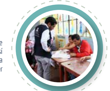
Electora sufragando en centro poblado de Jerez, (Cajamarca).