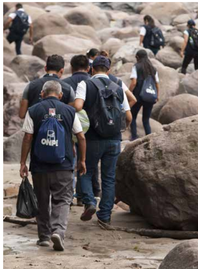
Coordinadores de ONPE camino a comunidad nativa Najén, Aramango (Amazonas).

El personal de la ONPE recorrió cada uno de los distritos donde se llevó a cabo el proceso electoral, capacitando a más de 47 mil electores convocados a las urnas y a los más de mil miembros de mesa; pero también incentivando a la ciudadanía, a elegir sus autoridades ediles.