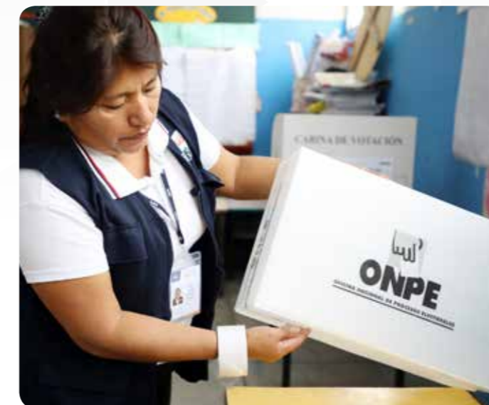
Acondicionamiento de ánfora para elecciones

Adicionalmente incluyó la capacitación sobre procedimientos electorales; la facilitación de implementos como ánforas, cabinas de votación, huelleros, lapiceros, entre otros; así como el asesoramiento en el diseño de material electoral y educativo.