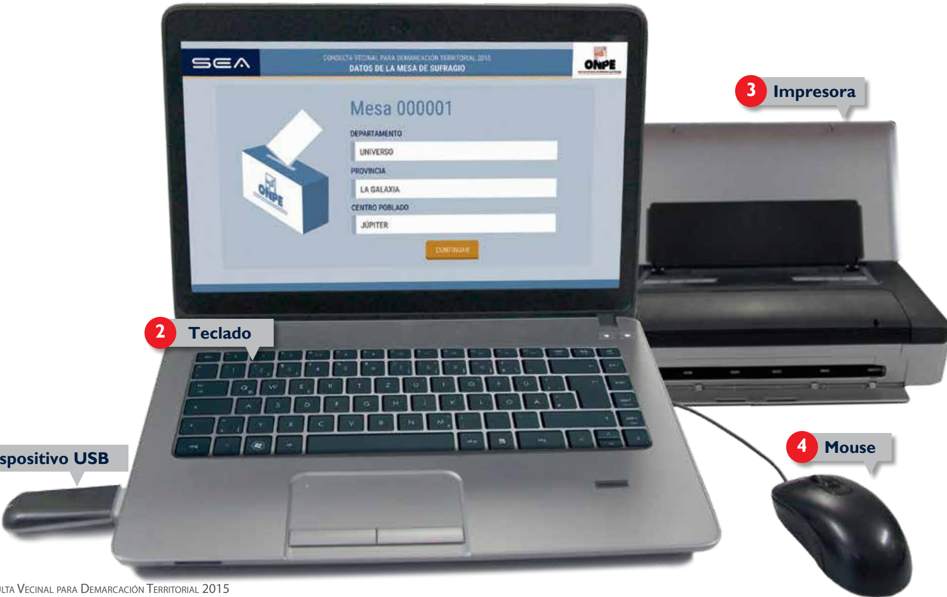
5 Dispositivo USB