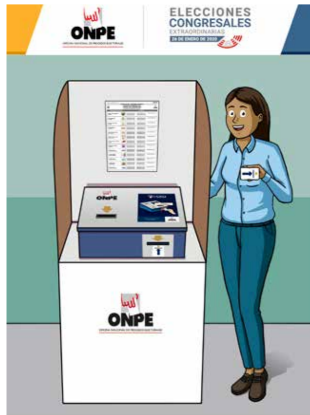
CARTILLA DEL ELECTOR Lima Metropolitana