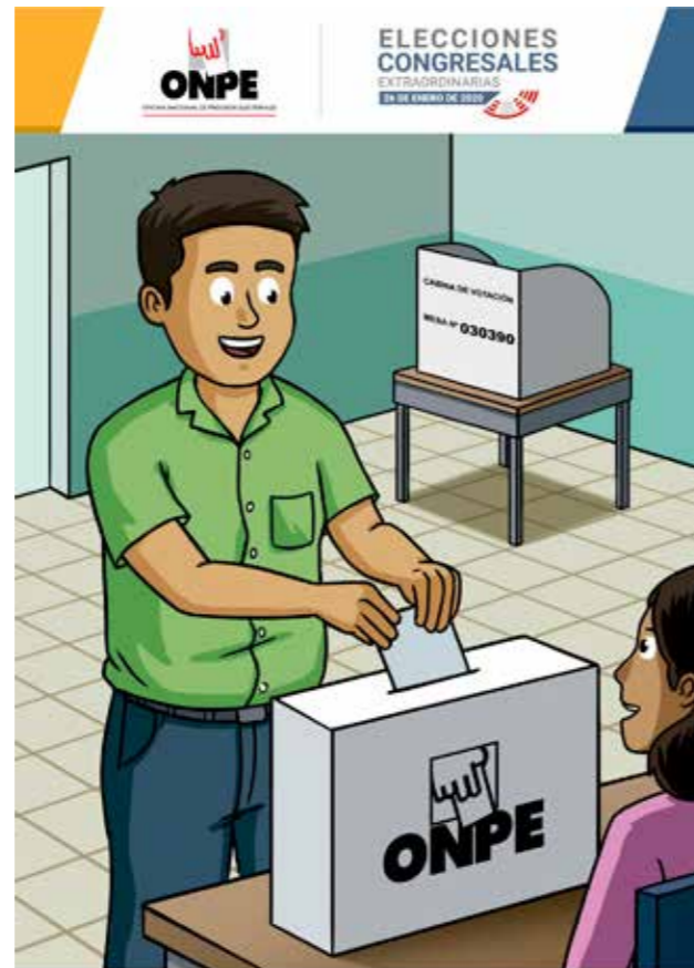
CARTILLA DEL ELECTOR

Se puede ingresar al local de votación para votar desde las 8:00 a. m. hasta las 4:00 p. m. (hora en que se cierra la puerta del local).