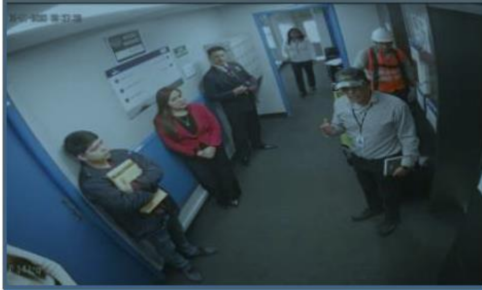
Figura N° 5. Imágenes de las Charlas realizadas en los pasillos de la Sede Central durante los días 02,03 y 06NOV