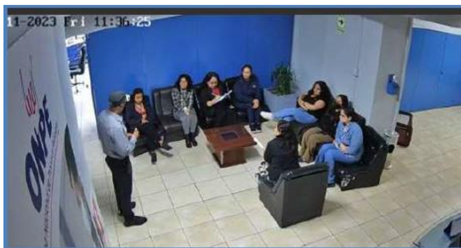
Figura N° 4. Imágenes de las Charlas realizadas en los pasillos de la Sede Central durante los días 02,03 y 06NOV