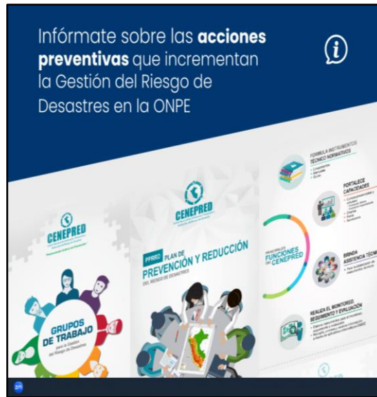
Figura N° 1. Acciones preventivas

2. En otra iniciativa, en conjunto con la GIEE, se solicitó la difusión de la presentación "Gestión del Riesgo de Desastres", como parte de los esfuerzos para reforzar la conciencia de seguridad y gestión del riesgo en la ONPE. Esta presentación fue ampliamente difundida a través de Comunicaciones ONPE, según el correo electrónico enviado el 31JUL2023.