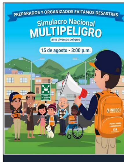
Figura N° 2. Aviso de Simulacro multi peligro

3. Asimismo, en una acción preventiva, se solicitó a SGBDH la difusión del aviso "SEGUNDO SIMULACRO NACIONAL MULTIPLELIGRO - MARTES 15 DE AGOSTO DE 2023 - 15:00 HORAS", con el propósito de fortalecer la conciencia de seguridad y gestión del riesgo. Este aviso fue ampliamente difundido a través de la Subgerencia, tal como se muestra en el correo enviado el 15AGO2023.