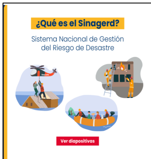
Figura N° 3. Presentación del SINAGERD

Desastres, fue exitosamente realizada y documentada mediante correo electrónico.